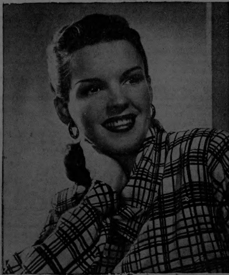
JUDY GARLAND Estrella de de la Metro Goldwyn Mayer

Judy Garland, una de las más fulgurantes luminarias de Hollywood, es también una sensata mujer que ha encontrado el secreto de com-