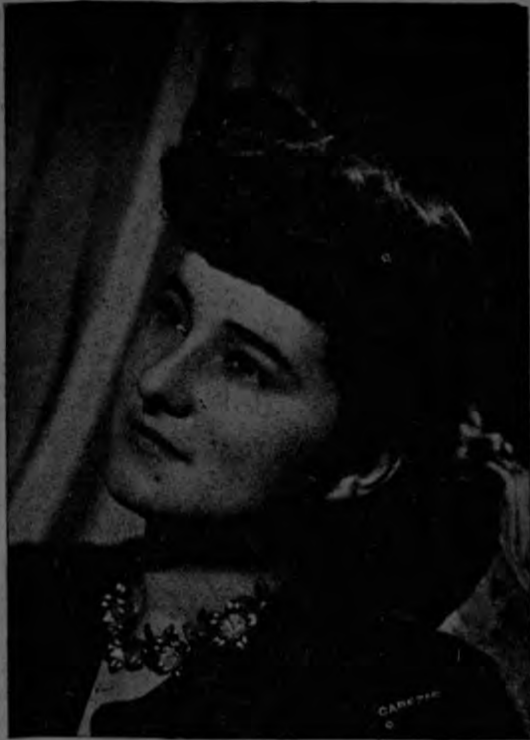
SEÑORITA JULITA ARAYA

Se encuentra entre nosotros, disfrutando de una temporada de descanso en el seno de su familia, la famosa mezzosoprano costarricense, señorita Julita Araya.